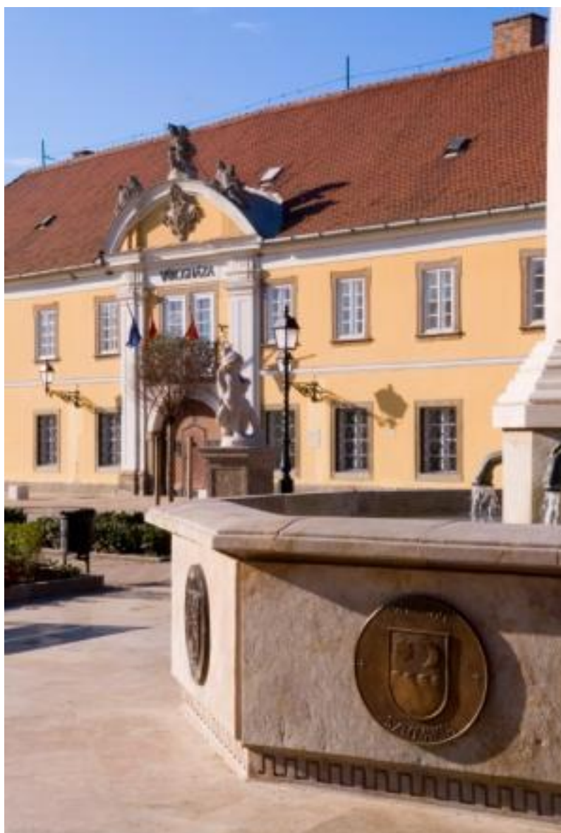
Viedenská Brána zo smeru ulice Köztársaság tvorí moderná varianta niekdajšej Viedenskej Viedenskej brány.